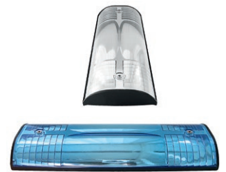
Wildwarnreflektor lichtblau und silberweiß