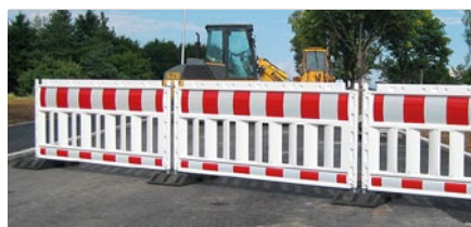
Leit- und Absperrschranken